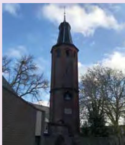
Linnaeustorentje in Harderwijk

Beroemde promovendi zijn de medicus Herman Boerhaave in 1693 en de plantkundige Carolus Linnaeus in 1735.