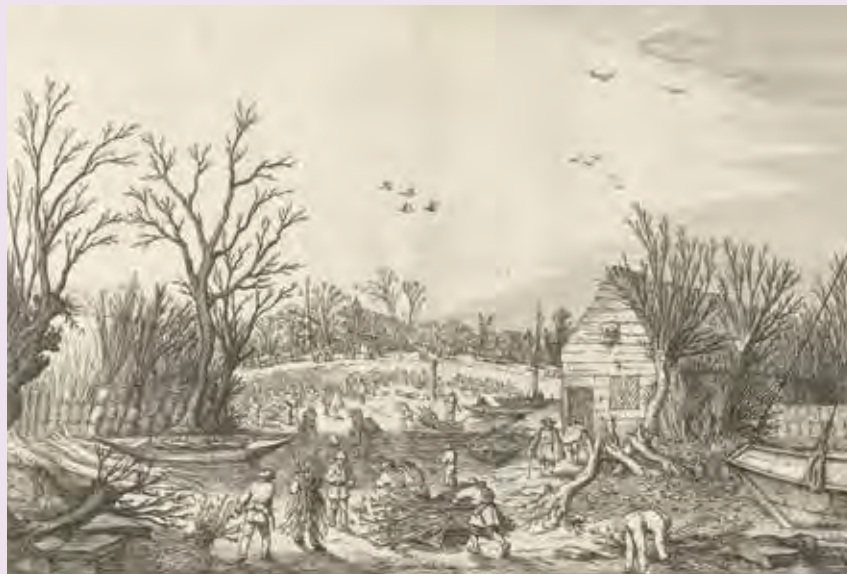
Herstelwerkzaamheden aan de doorgebroken Lekdijk bij Vianen, Esaias van de Velde, 1624

Veel gereformeerden zagen Nederlanders als een uitverkoren volk. Als ware de gezegende Nederlanders gered uit de zovloed. Ze werden beschermd door dijken en waren in staat water om te zetten in vruchtbaar land. Het Leids Ontzet in 1574 werd gezien als een goddelijk ingrijpen, zulke gebeurtenissen kregen een Bijbelse betekenis. Dat kon ook gelden voor overstromingen, want dergelijke rampen werden geïnterpreteerd als een toornige straf of een voorteken voor het één of het ander. Uit het feit dat het water een vervloeking of een zegening kon zijn, kon men opmaken dat dit volk bescherming genoot van de almachtige God.