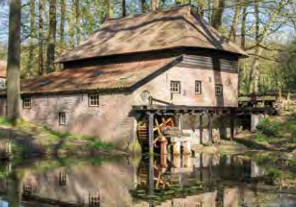
Veluwe papiermolen in het Nederlands Openluchtmuseum in Arnhem