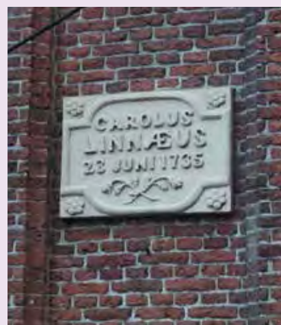
Plaquette op het torentje