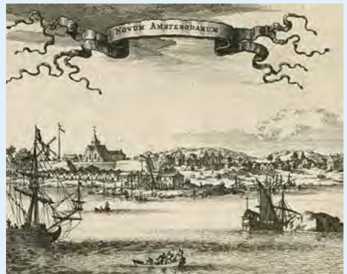
Nieuw-Amsterdam, Jacob van Meurs, 1671

Bron: Nieuw Amsterdam van Russel Shorto , p. 217-218.