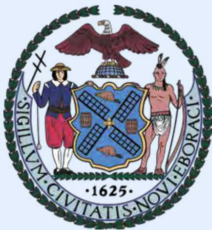
Wapen New-York City

Het wapen van New York City vertelt ons iets over haar ontstaansgeschiedenis met de molenwieken en bevers. Het jaar 1625 verwijst naar het jaar dat de WIC opdracht had gegeven tot de aanleg van Fort Amsterdam.